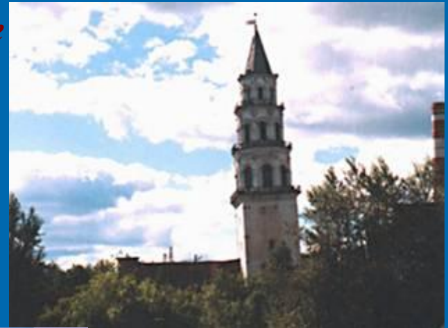
Невнянская наклонная башня

Казанский кремль представляет собой пример синтеза русской и татарской архитектуры. Территория кремля, имеющая форму неправильного многоугольника, окружена крепостными стенами, высота которых 8-12м., и башнями. Нынешние стены и башни построены русскими в XVIв., реконструированы в XVIIв.