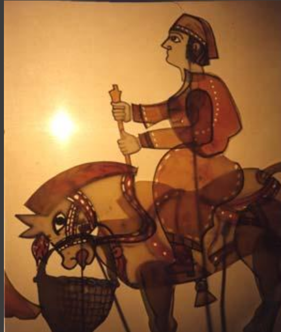
6. Куклы театра теней