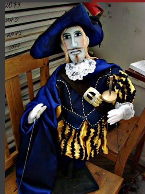
3. Тростевая кукла