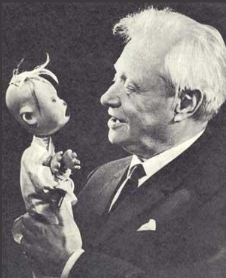
С. В. Образцов с куклой Тяпой.