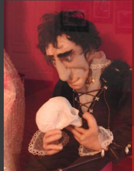
7. Мимирующая кукла