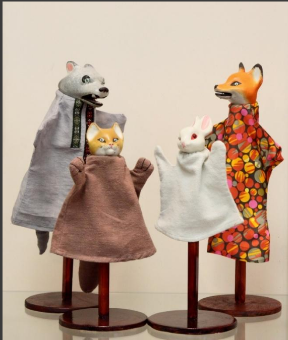
5. Перчаточная кукла