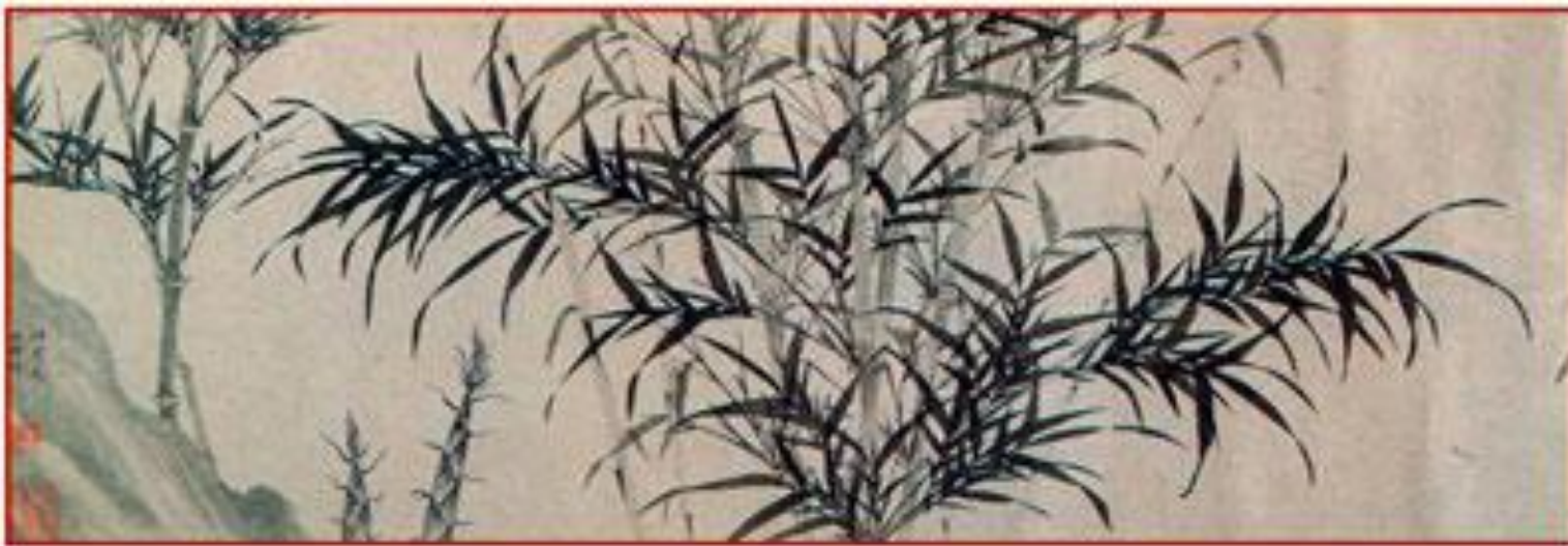
Ли Кан. Бамбук. Тушь по бумаге. XIII в.