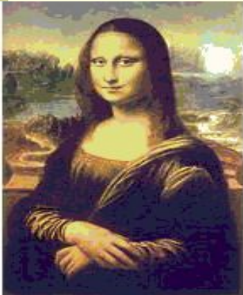
Мона Лиза (Джоконда)