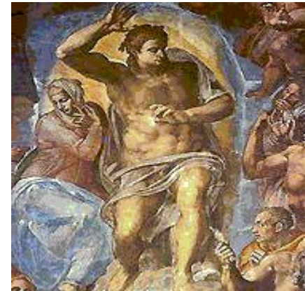
Христос – судия и богоматерь

Большую славу художник получил как автор фресок в Сикстинской капелле