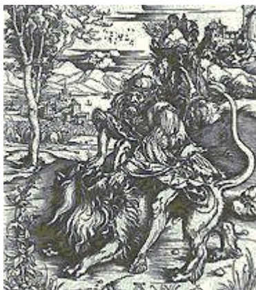
Самсон убивает льва