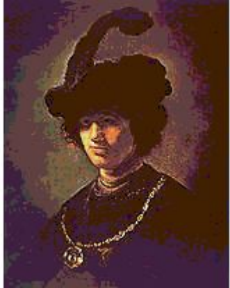
Автопортрет в молодости