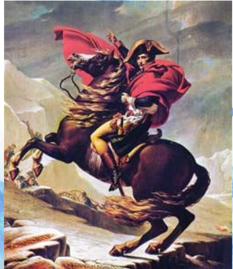
Переход Наполеона через Альпы. 1800.