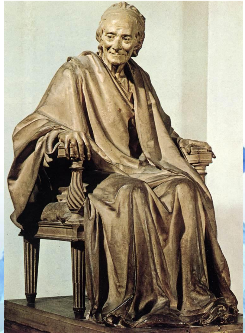
Жан Антуан Гудон. Вольтер 1779-1781 «Комеди Франсез», Париж