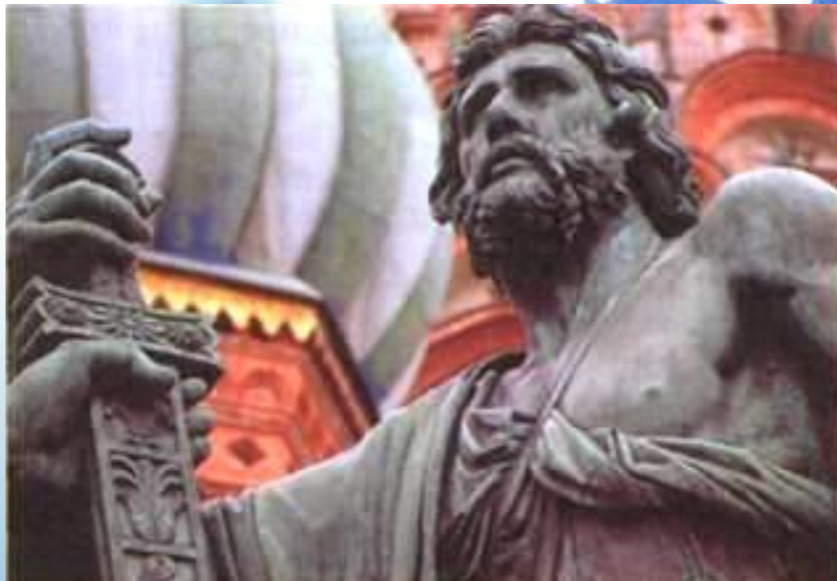
Иван Мартос. Памятник Минину и Пожарскому (фрагмент)