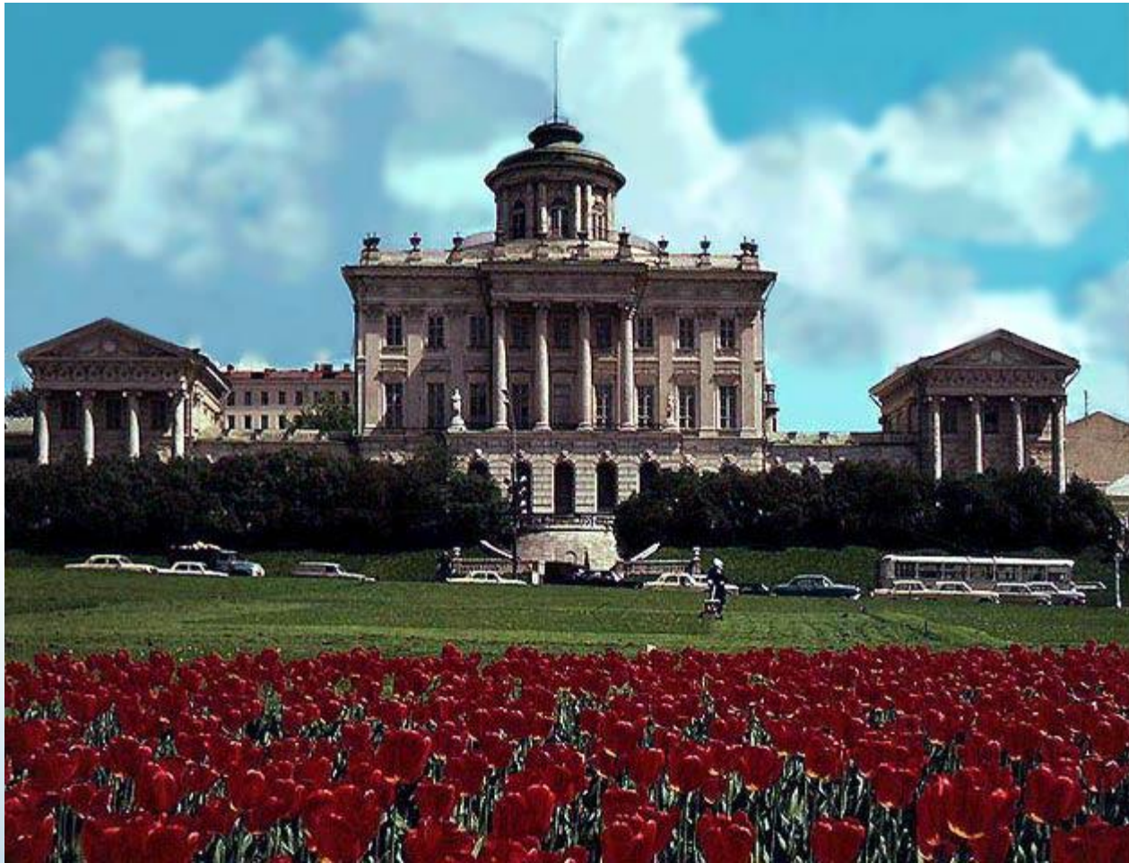
Дом Пашкова В.И.Баженов, 1784-1786 Россия, Москва