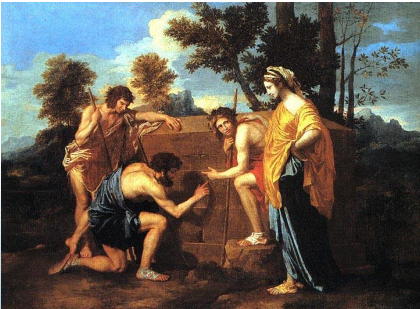
Пастухи в Аркадии 1638-1640