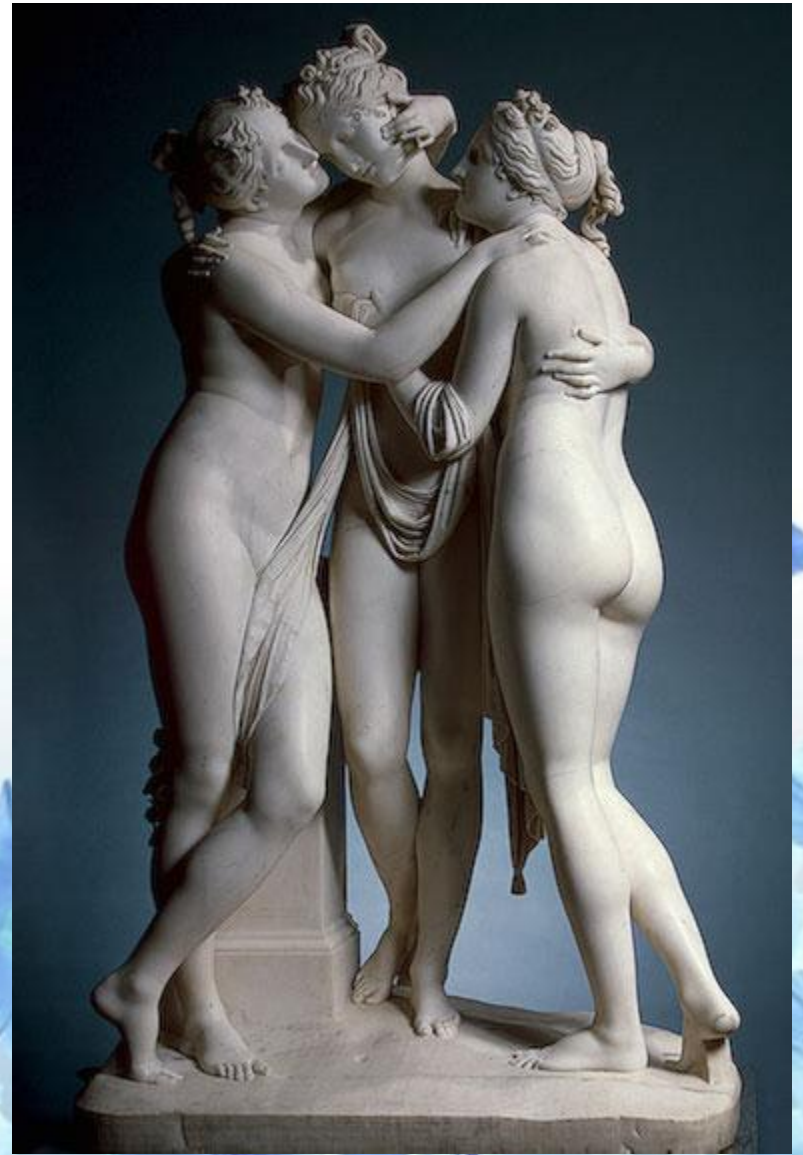
Антонио Канова. Три Грации. 1816г. Эрмитаж