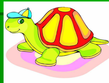
Земноводные и пресмыкающиеся