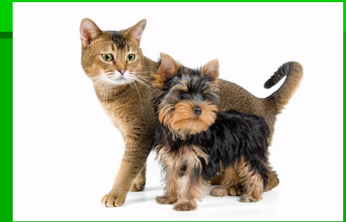
Кошки и собаки