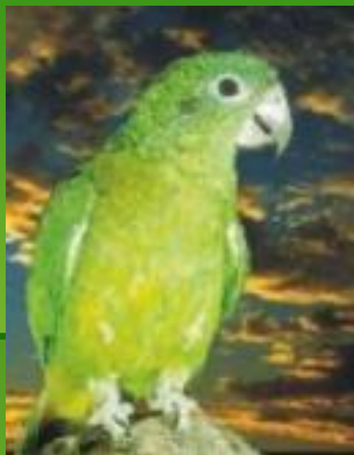
Ямайский черноклювый амазон