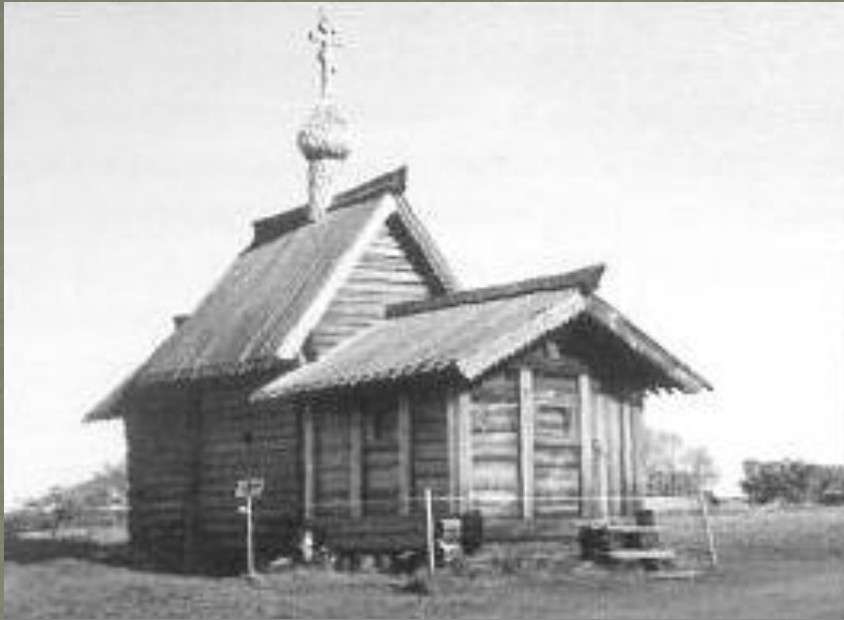
Церковь Воскрешения святого Лазаря

Древнейшая из них — церковь Воскрешения святого Лазаря — находится в музее деревянного зодчества в Кижях в Карелии. Некоторые ученые считают, что она была построена ещё в конце XVI века.