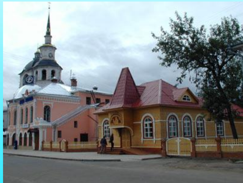
Почта Деда Мороза