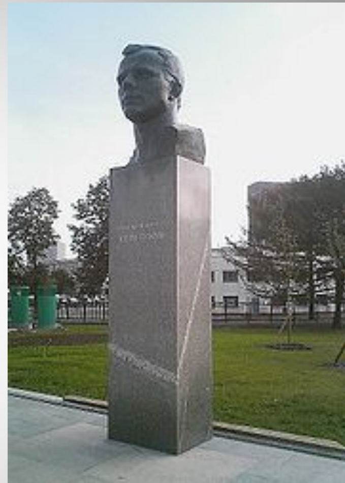
Памятник Юрию Алексеевичу Гагарину в Москве, Россия

Ю.А.Гагарин - кавалер общественного ордена «Гордость России» (посмертно), учрежденного благотворительным фондом «Гордость Отечества».