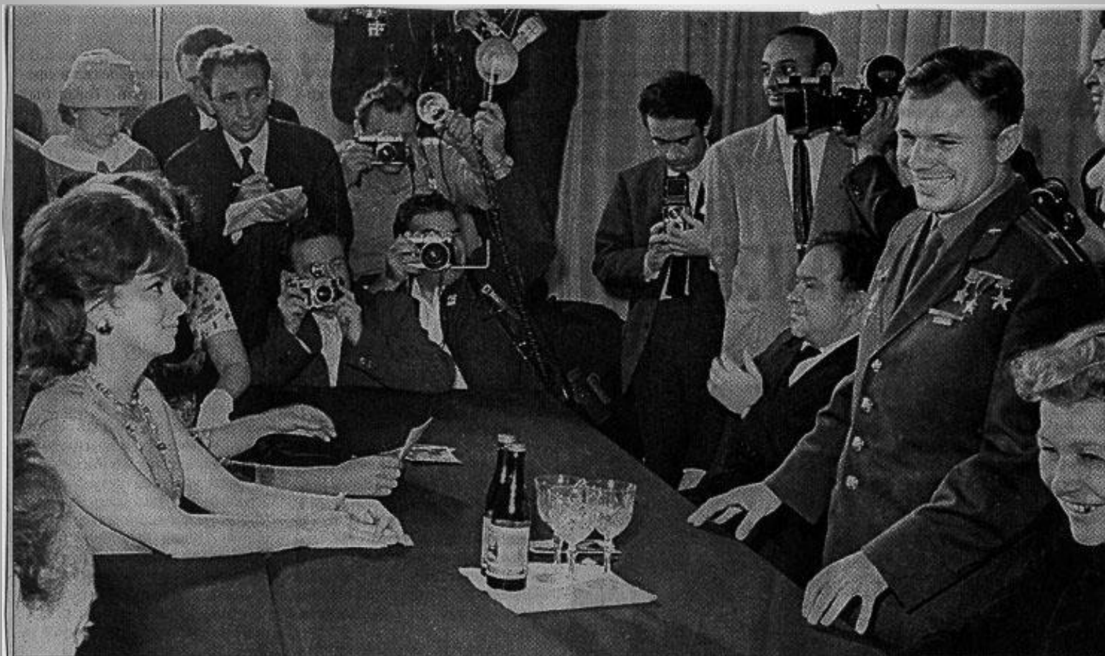
Июль 1961 года. Актриса Джина Лоллобриджида встретила с Юрием Гагариным на II Московском кинофестивале