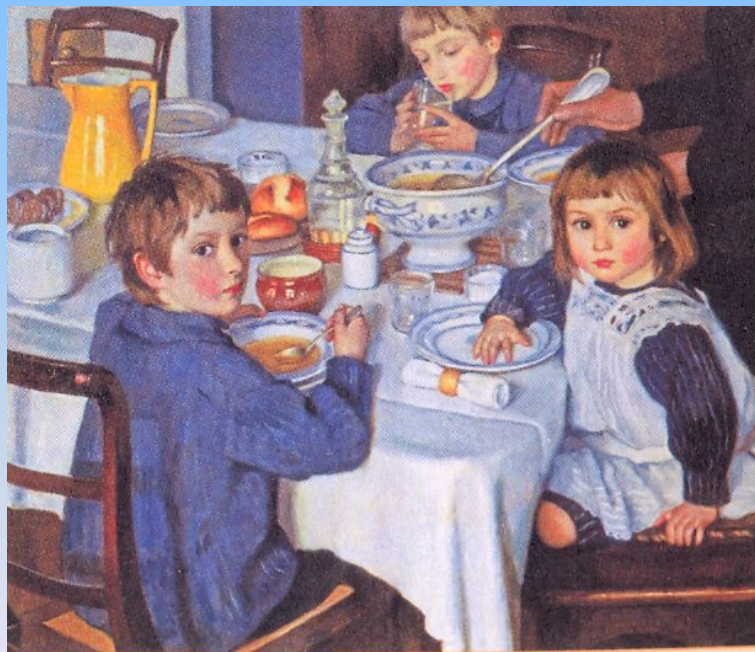
З. Серебрякова. За завтраком. 1914 г.