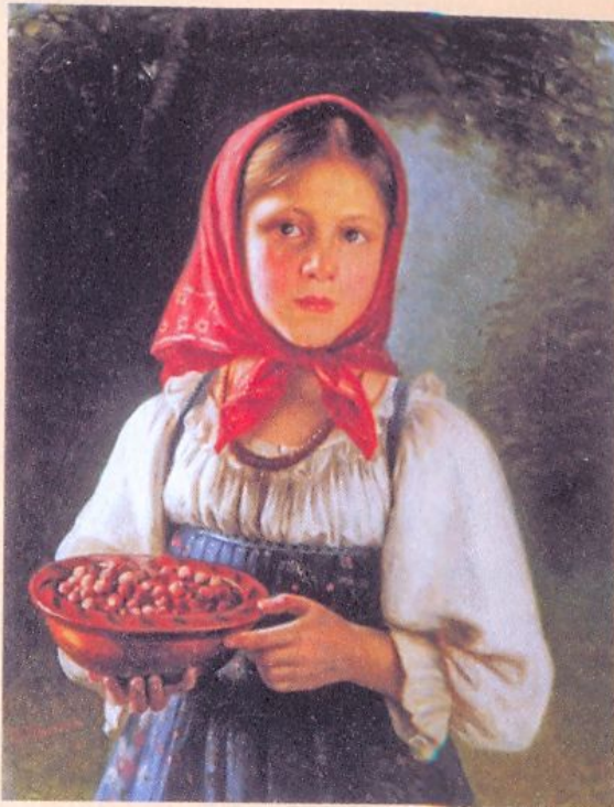
В. Тимофеев. Девочка с ягодами. 1879 г.

Есть такие интересные сведения: подсчитано, что в среднем за 70 лет своей жизни человек съедает около 50 000 кг пищи, в том числе 200-300 кг поваренной соли, и выпивает более 50 000 кг воды, что примерно в 1400 раз больше массы его тела.