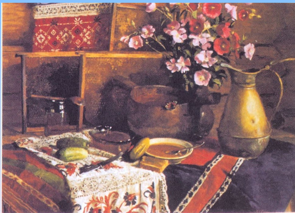
Н. Соломин. Июльский медосбор. 2000 г.