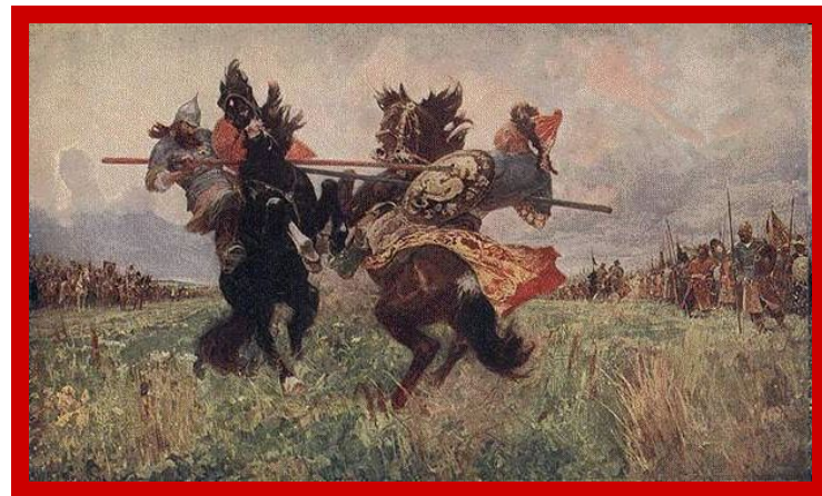
АВИЛОВ. ПОДИНОК ПЕРЕСВЕТА С ЧЕЛУБЕЕМ.