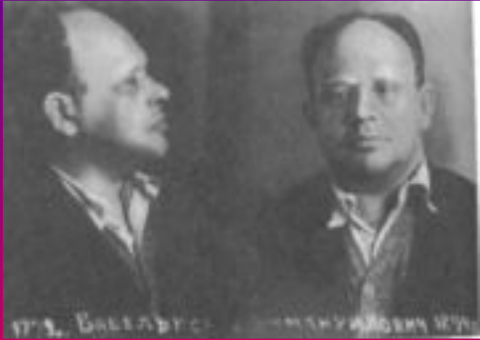
Бабель перед казнью