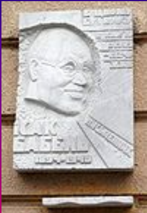
Мемориальная доска в Одессе, на доме, где он жил