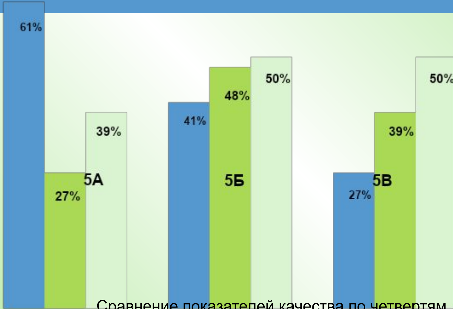
Сравнение показателей качества по четвертям