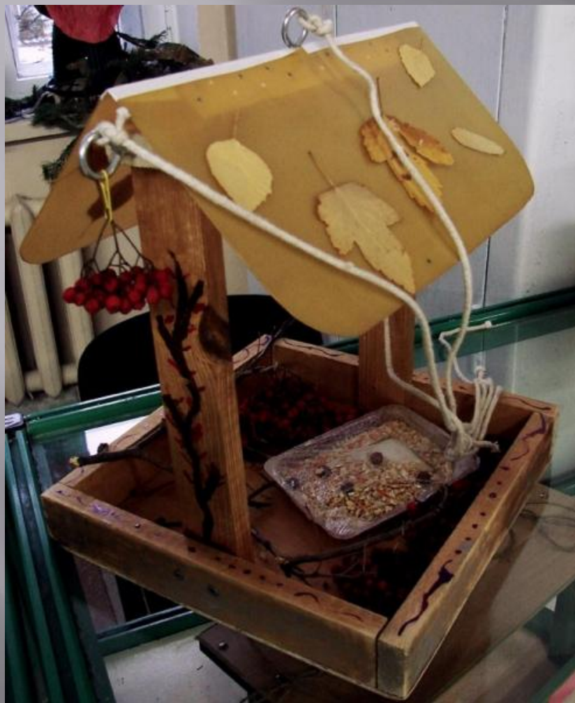
БАЖАН ДЕНИС, 1 «В»