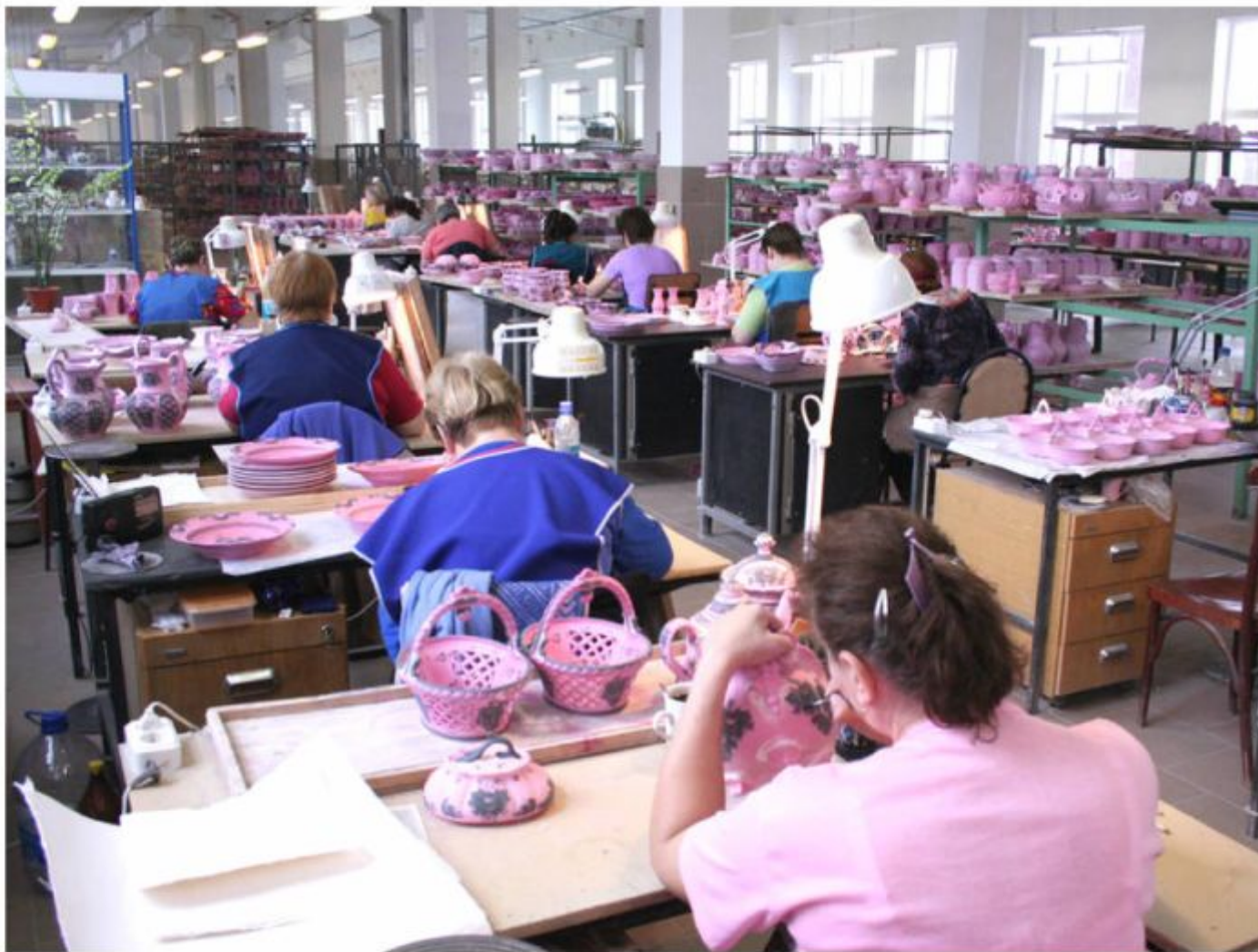
Цех художественной росписи