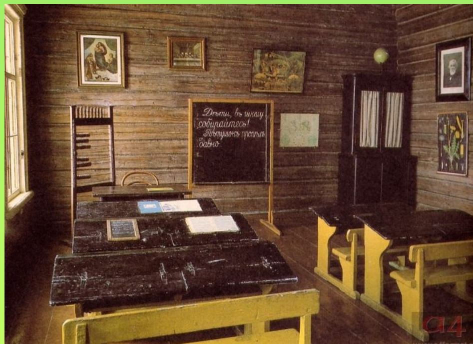
Класс мелиховской школы

В Мелихове и его окрестностях Чехов строит три школы для крестьянских детей.