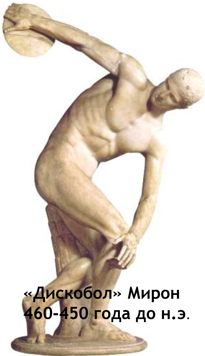
«Дискобол» Мирон 460-450 года до н.э.