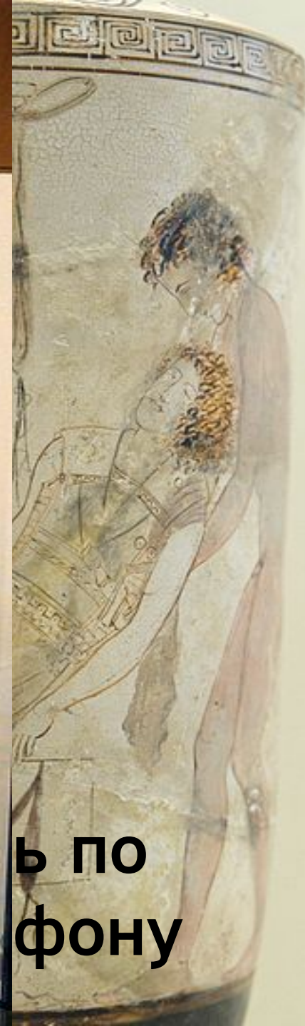
ь по фону