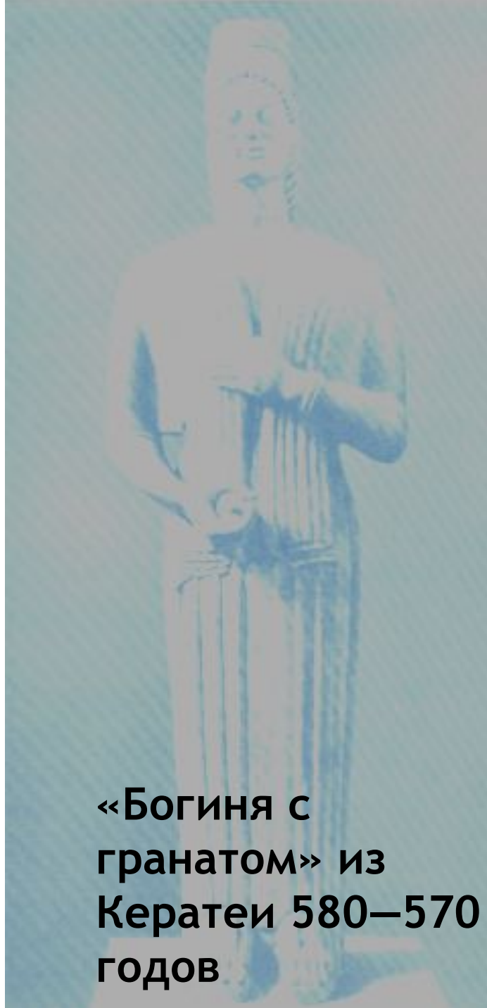
«Богиня с гранатом» из Кератеи 580—570 годов