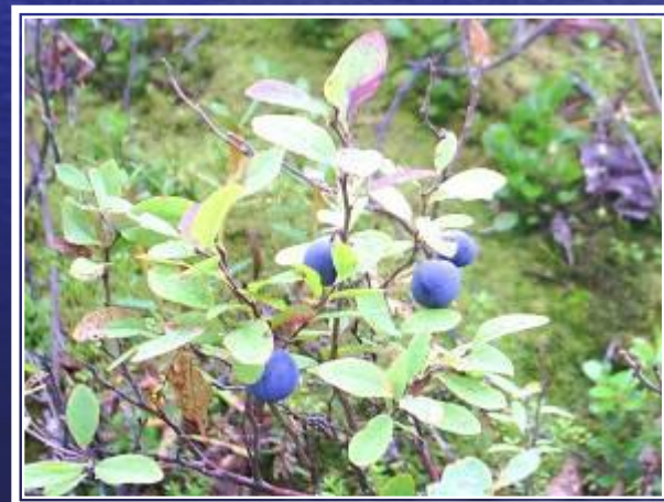
че р ника