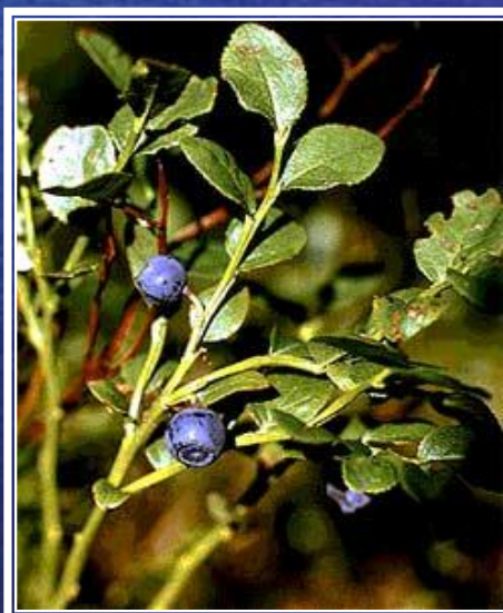
го л убика