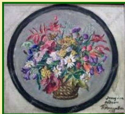
Осенний букет в корзине