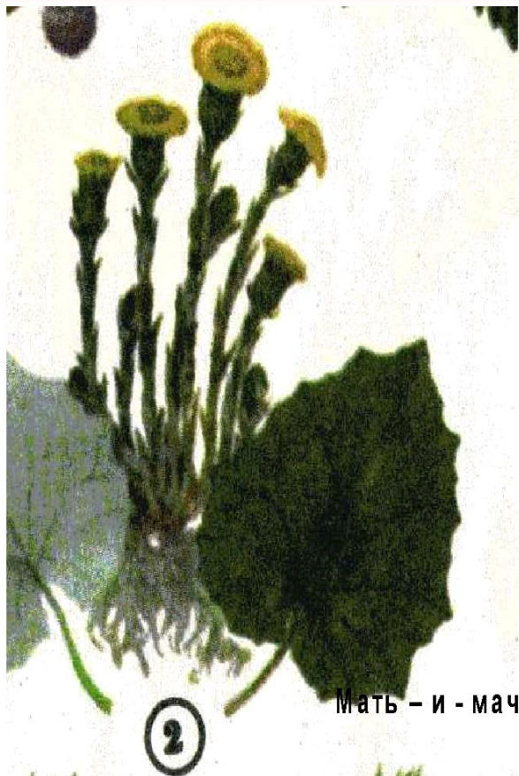
Мать – и - мачеха