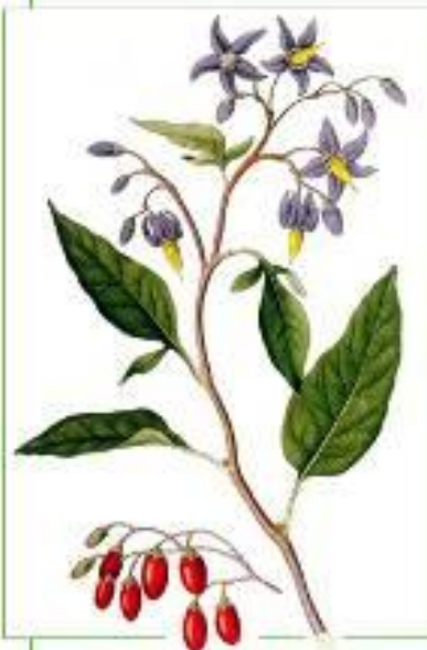
Паслен сладко - горький