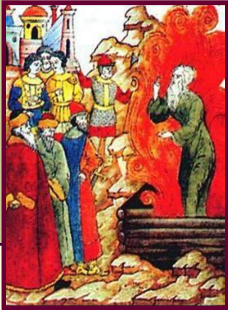
Сожжение протопопа Аввакума. Миниатюра к.17 в.

Главой старообрядцев стал протопоп Аввакум.