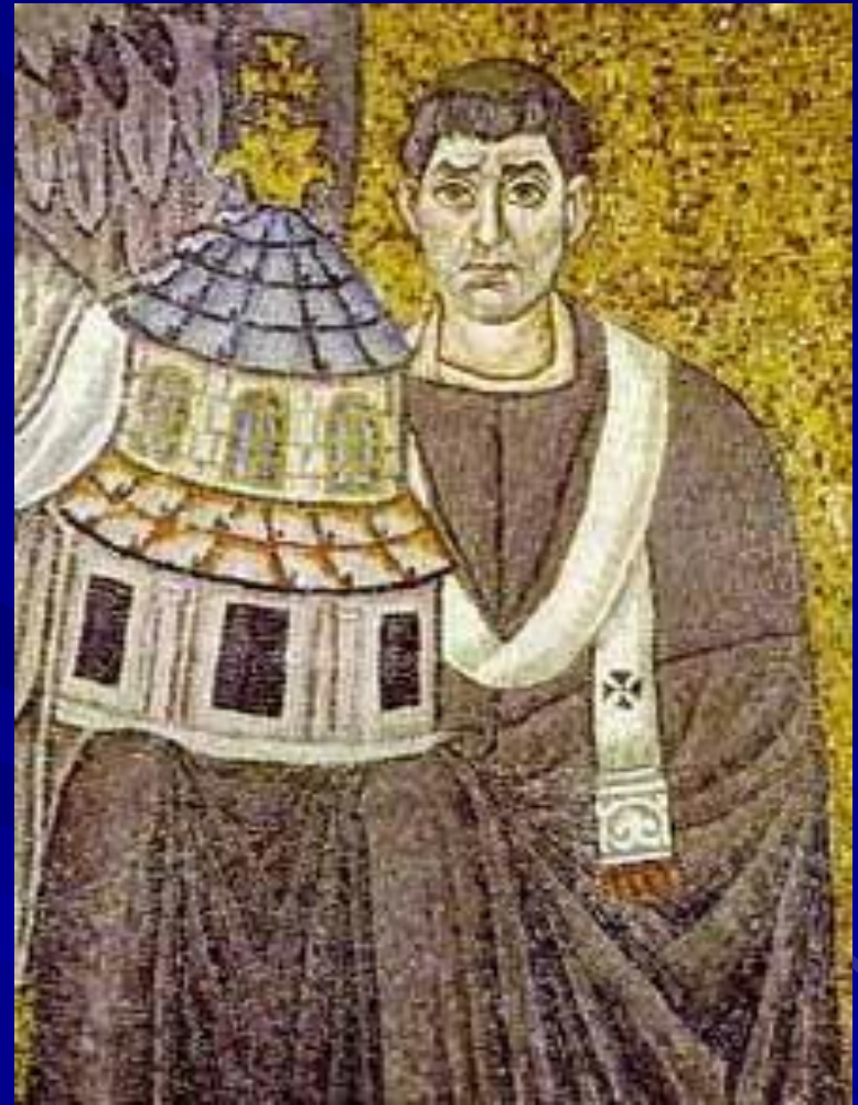
S. Vitale, Ravenna Apse mosaic Detail