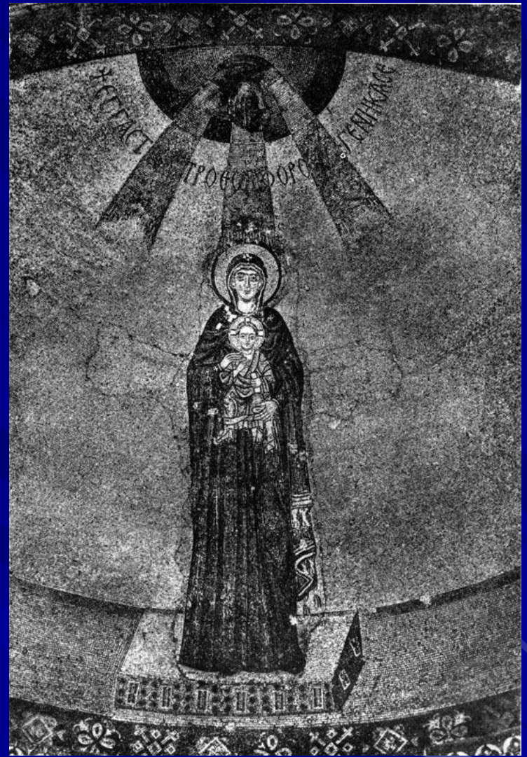
Богоматерь с младенцем. Мозаика абсиды церкви Успения в Никее. Вскоре после 787 г.