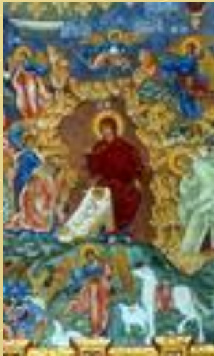
Фрагмент фрески в церкви Ильи Пророка в Ярославле