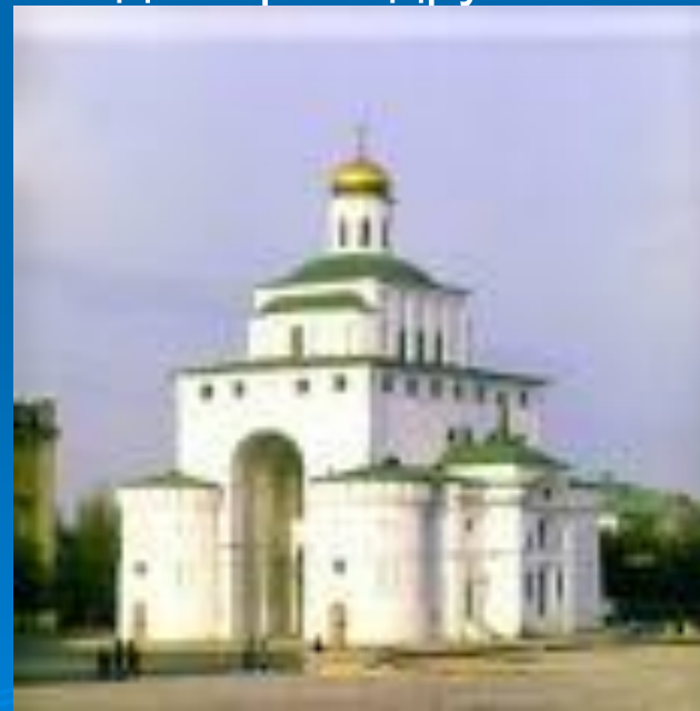
Золотые ворота во Владимире