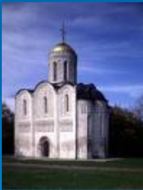
Дмитриевский собор во Владимире