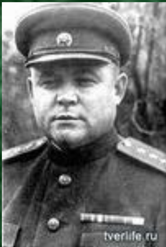
Ватутин Николай Фёдорович