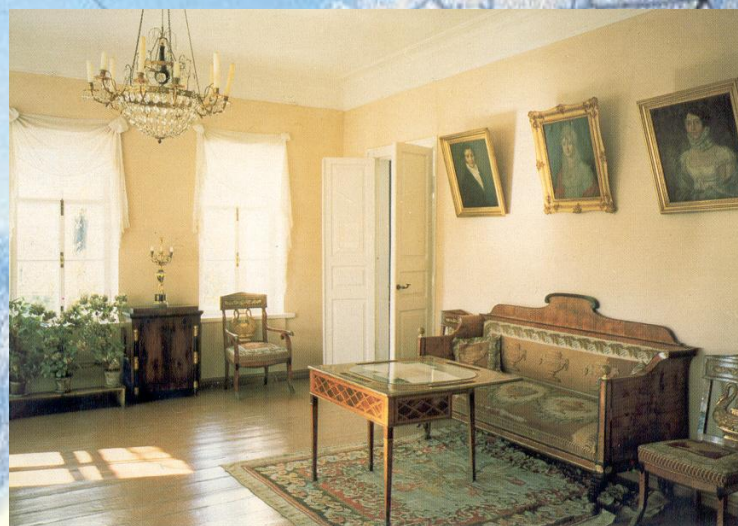
Зала в имени Лермонтовых