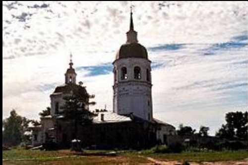
Церковь Преображения Спасителя, около 1750

Енисейск долгое время был культурным центром Енисейской губернии.