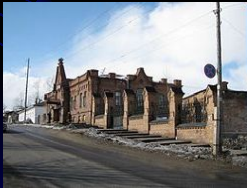
Аптека в Енисейске

Енисейск был крупным центром иконописного искусства. В 1669 году в городе работали пять иконописцев. В 1760 — 1780-х годах были известны енисейские иконописцы Григорий Кондаков и Максим Протапопов.