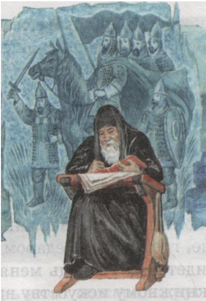
Нестор – летописец, автор «Повести временных лет»

Основными источниками сведений о жизни Святослава являются «История» Льва Дьякона и «Повесть временных лет» .