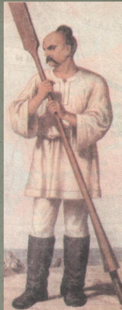
Князь Святослав Рисунок XIX в.