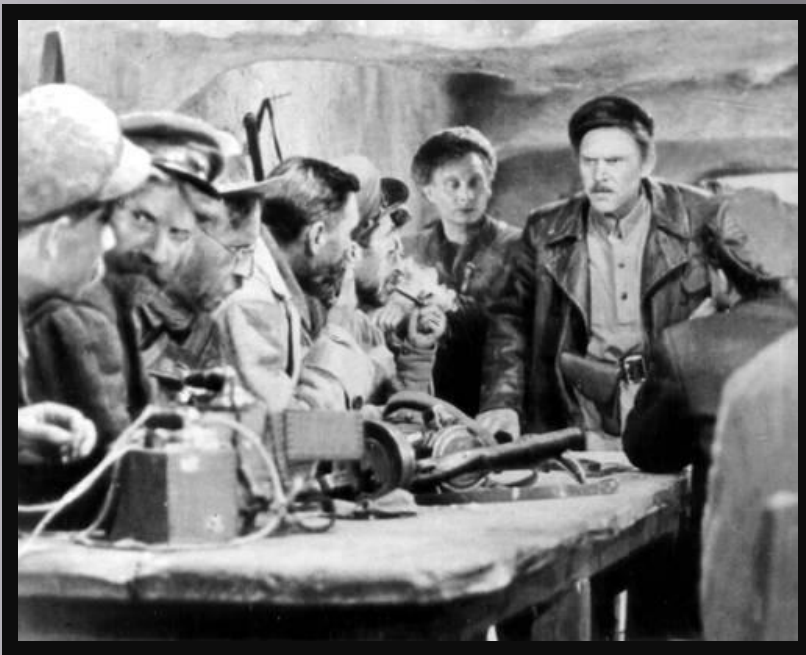
«Секретарь райкома», И. Пырьев(1942)