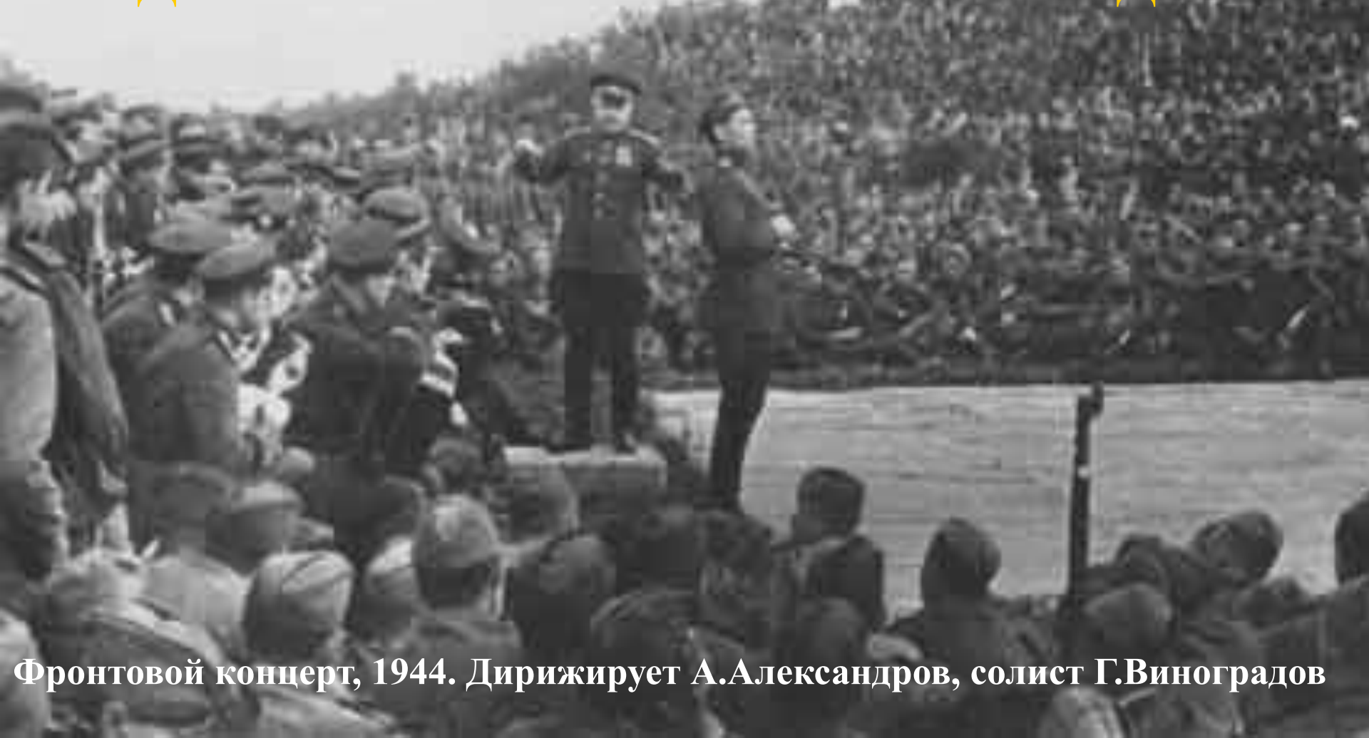
Фронтной концерт, 1944. Дирижирует А.Александров, солист Г.Виноградов

Цель: показать роль искусства в героизме всего народа, в достижении Великой Победы.