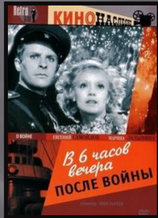
«В шесть часов вечера после войны» И. Пырьев