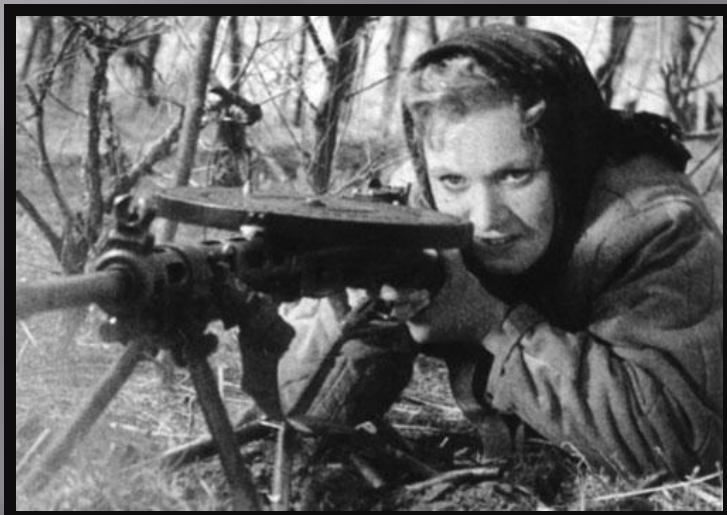
Она защищает Родину (1943) Ф. Эрмлер