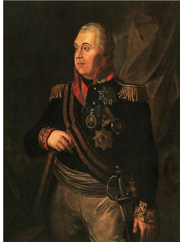
Михаил Илларионович Кутузов