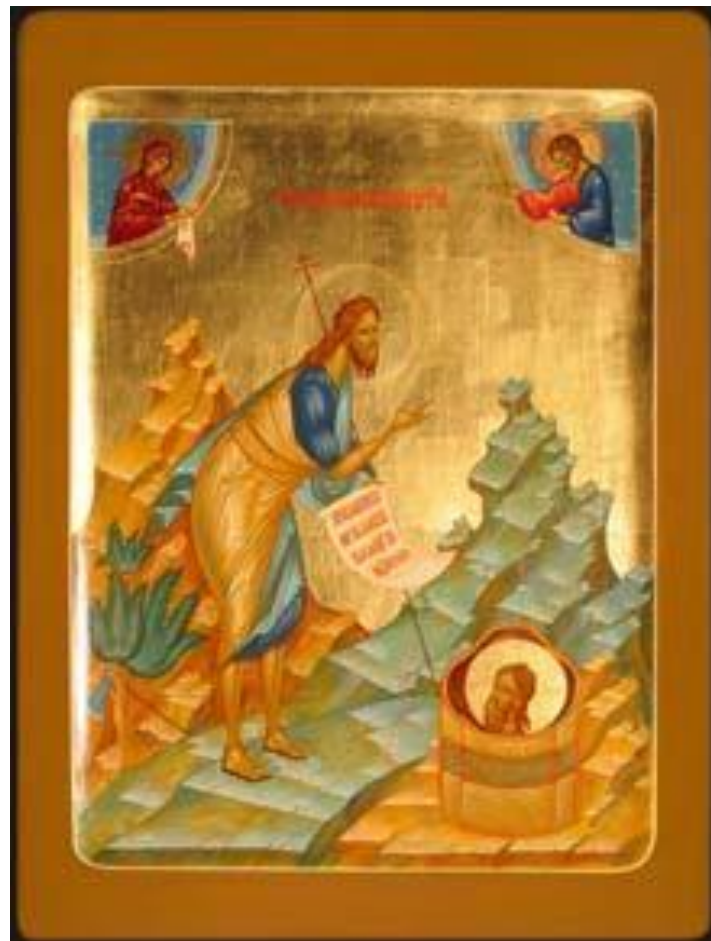
Икона «Иоанн Предтеча», современный мастер