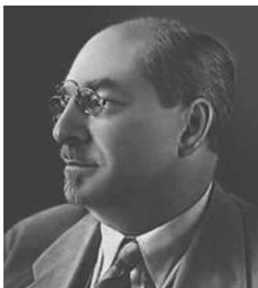
А. В. Луначарский