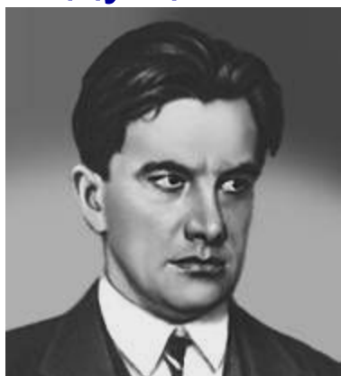
В. В. Маяковский

«Человек для нас ценен не тем, что он переживает, а тем что он делает»