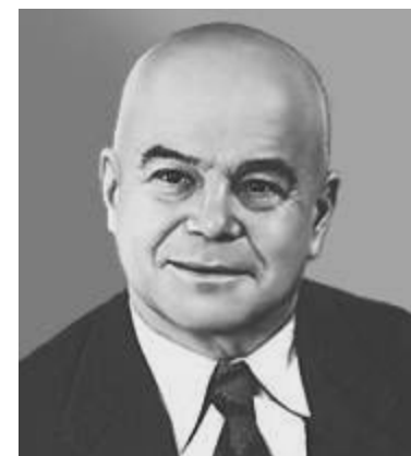
В. Б. Шкловский