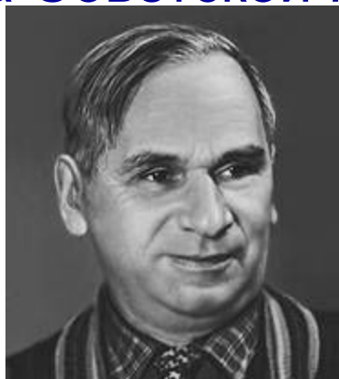
Е. О. Габрилович