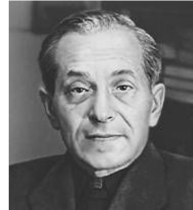
М. М. Зощенко