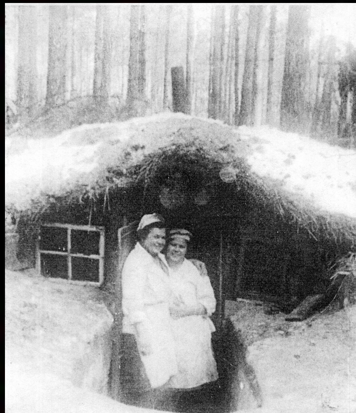
У фронтовой землянки.