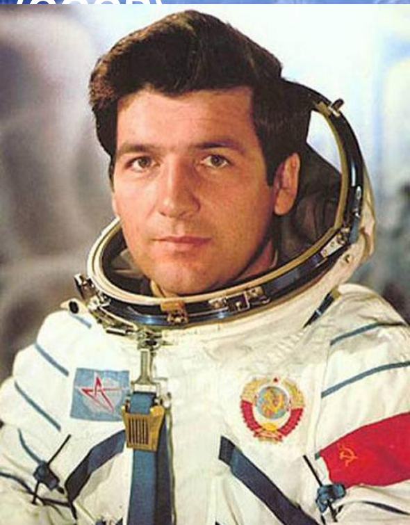
Петр Климук 36 лет.

Космонавты: Петр Климук и Мирослав Гермашевский Дата: 27 июня-5 июля 1978 Корабль: Союз-30