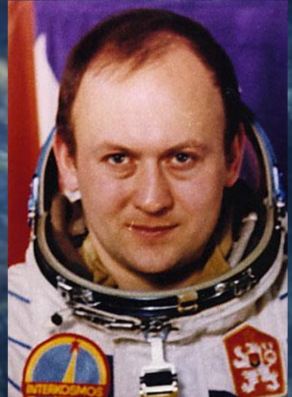
Владимир Ремек 30 лет

Космонавты: Алексей Губарев и Владимир Ремек Дата: 2-10 марта 1978 Корабль: Союз-28