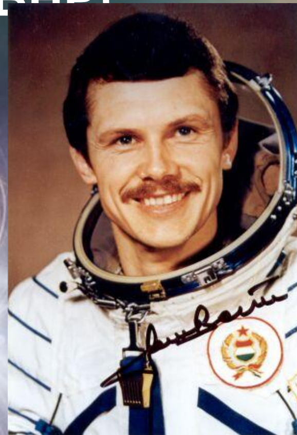
Берталан Фаркаш 31 год.