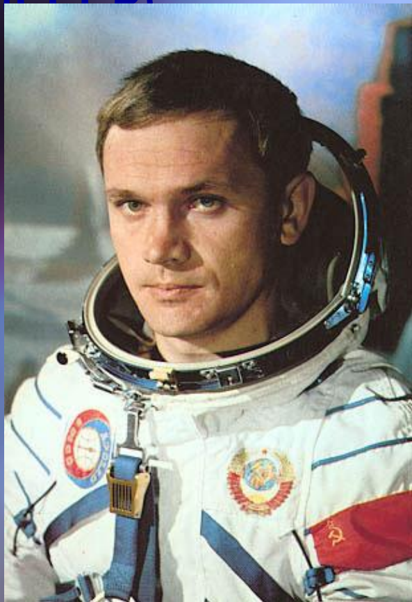
Владимир Джанибеков 39 лет

Космонавты: Владимир Джанибеков и Жугдэрдэмидийн Гуррагчаа Дата: 22-30 марта 1981 Корабль: Союз-39