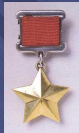
Шабалин Александр Осипович 4. 11. 1914 - 16. 1. 1982 Дважды Герой Советского Союза