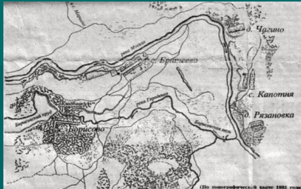
(По топографической карте 1881 года)