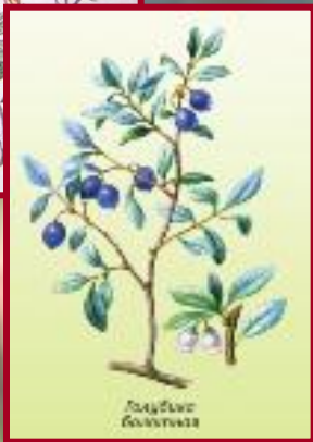
Растение семейства брусничных