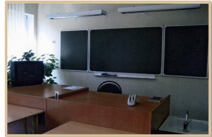
Рабочая зона учителя