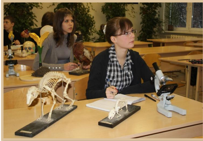
Рабочая зона учащихся