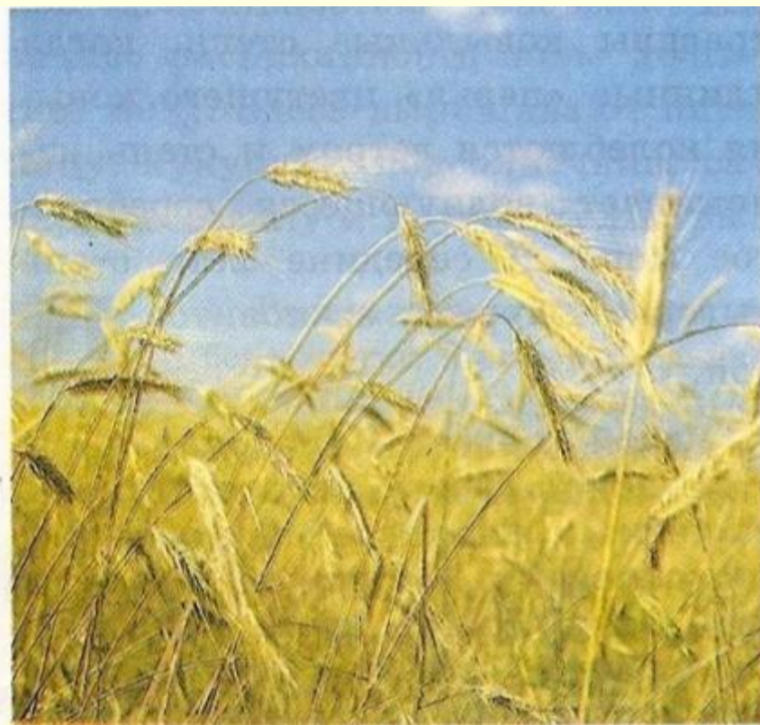
Посевы зерновых в степной зоне