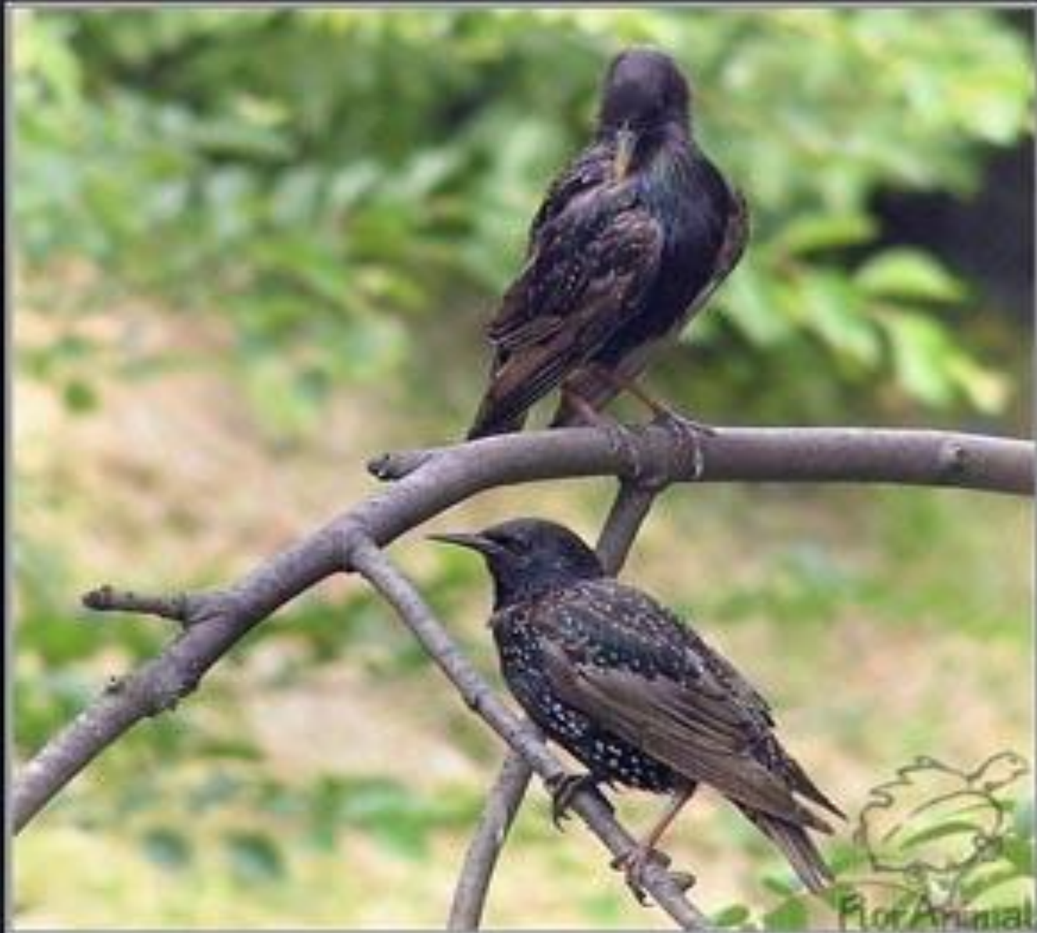
ငါးစုံချို (Sternus vulgaris)