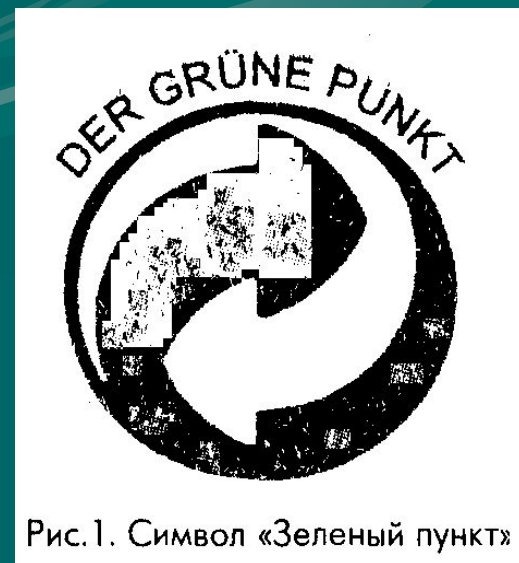
Рис.1. Символ «Зеленый пункт»

С 1992 г. на частной основе проводится программа «Дуальная система Германии». Предприниматели, использующие или реализующие упаковочные материалы, платят взносы в систему предприятий по утилизации отходов: забор мусора, транспортные расходы, строительство мусороперерабатывающих фабрик и т.д. В рамках этой программы на упаковочных материалах, которые обязательно должны быть переработаны, ставится символ «Зеленый пункт» (рис.1). Финансовые затраты на сбор и вторичную переработку учтены в цене на товары. Символ «Зеленый пункт» ни в коем мере не является показателем экологичности товара, этот символ относится к упаковочному материалу.