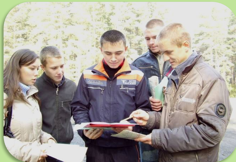
Разработка маршрута тропы