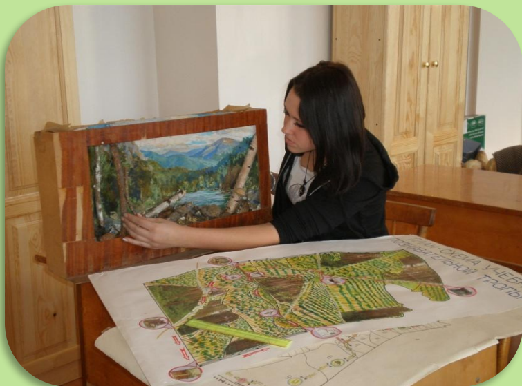
Разработка макета и схемы тропы