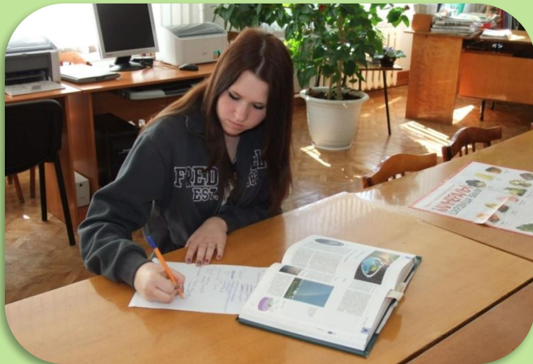
Работа в библиотеке