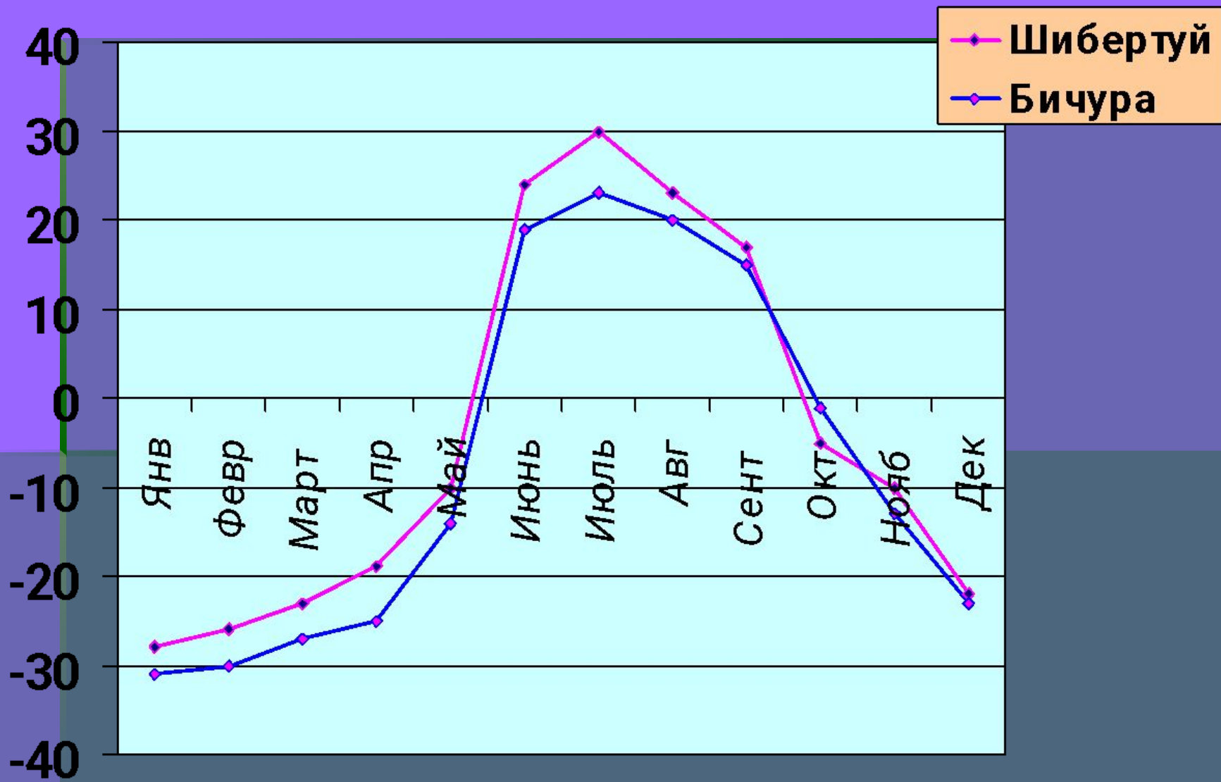
Диаграмма средней температуры воздуха Синяя полоса- температура с.Бичуры и розовая-с.Шибертуй. В Шибертуйе было теплее.