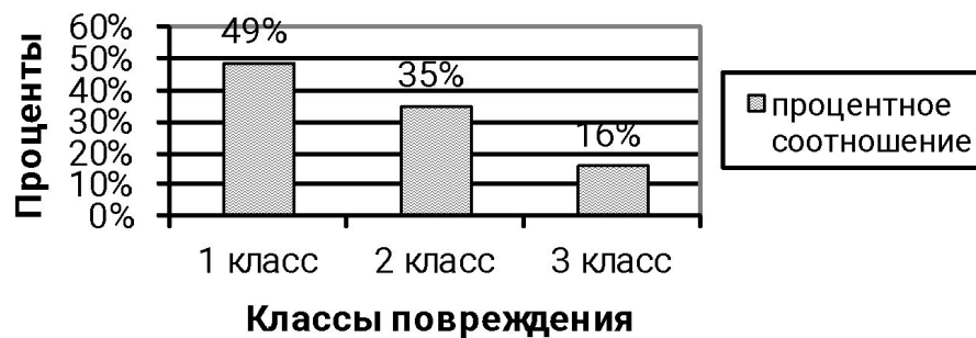
Среднее количество хвоинок по классам повреждения (Диаграмма №1) Участок 1

ГРЭС №5 – один из загрязнителей Шатурского воздуха