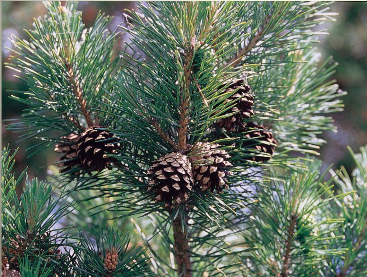
Сосна обыкновенная – ( Pinus sylvestris ).

Сосна обыкновенная может служить индикатором чистоты воздуха.