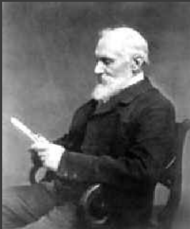
Лорд кельвин в конце жизни

Лорд Кельвин умер 17 декабря 1907 г. и по достоинству покоится в Вестминстерском аббатстве рядом с сэром Исааком Ньютоном.