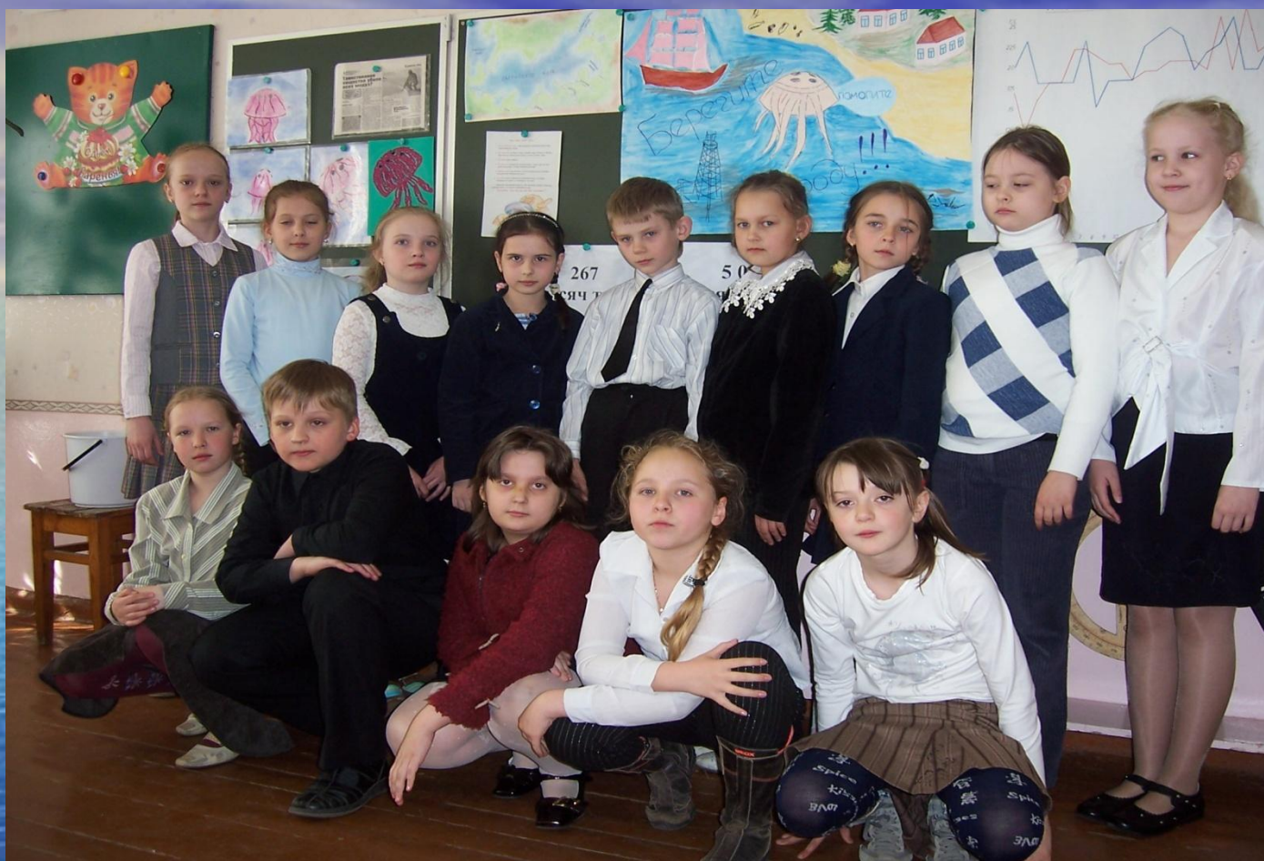
АГИТБРИГАДА 3 КЛАССА «А» МОУ СОШ №16 г. Калининграда