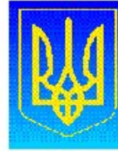
Герб Украины Президент Украины