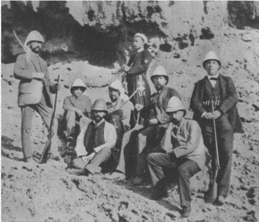
Die deutsche Cholera-Expedition in Ägypten; Koch ist der Dritte von rechts