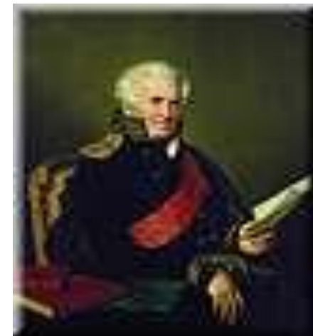
А. С. Шишков