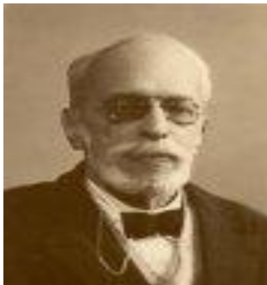
Н. М. Шанский

«Нет на земле такого языка, который был бы совершенно свободен от иноязычных влияний, так как ни один народ не живет совершенно изолированной обособленной жизнью», - так в своей книге «Лексикология современного русского языка» утверждает Николай Максимович Шанский.