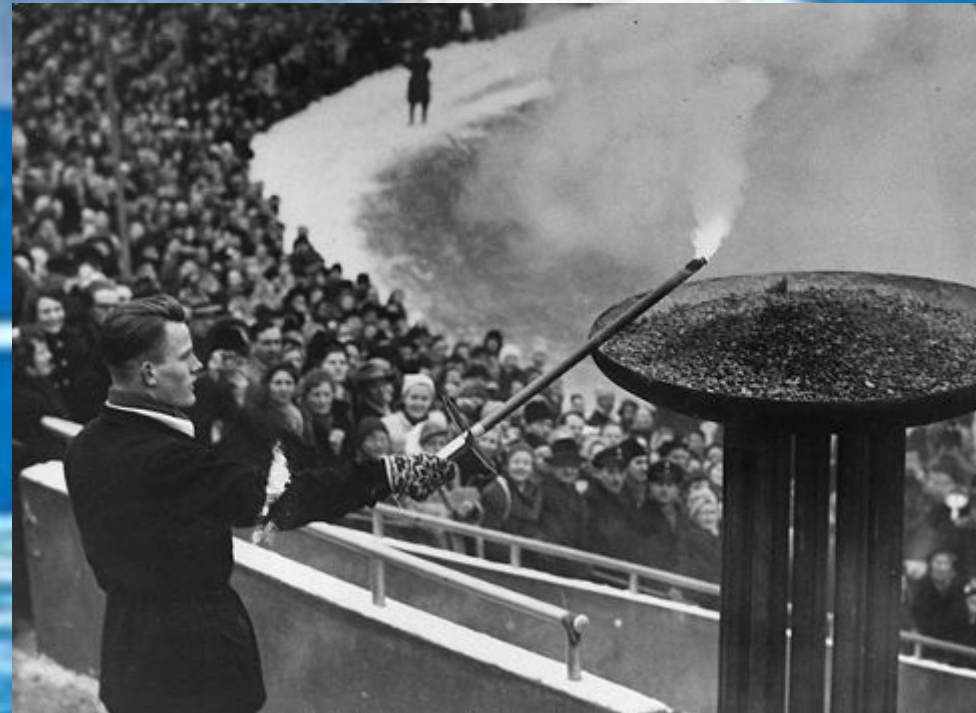
Зажжение олимпийского огня в Осло

VI зимние Олимпийские игры в норвежском Осло стали «авторами» многочисленных новшеств – впервые олимпийский факел путешествовал по всей стране, впервые Игры открыла женщина (наследная принцесса Норвегии Рагнхилд объявила об открытии VI зимних Олимпийских игр), впервые они прошли не в курортном городке, а в столице государства.